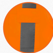
Fechamento do bolso em velcro.