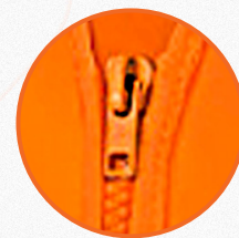
Fechamento frontal em zíper.