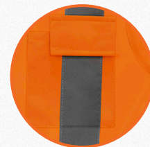
Fechamento do bolso em velcro.